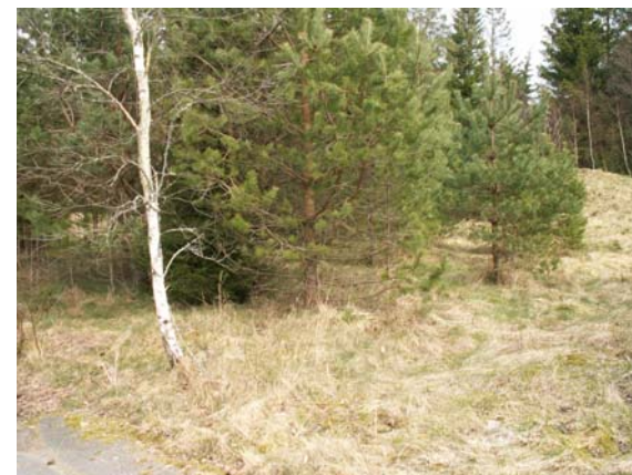
Vy från sydväst